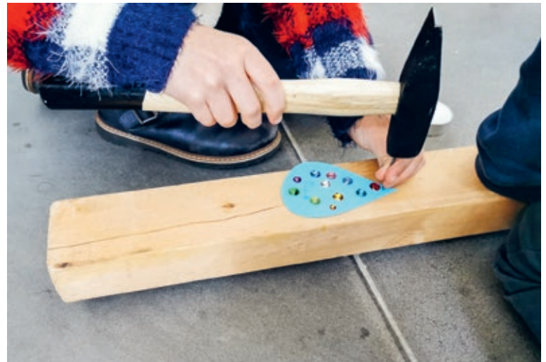
Gebete auf kleine Zettel schreiben und sie dann gemeinsam in ein Holzkreuz nageln. ↓

Der Einzug von Jesus in Jerusalem, das letzte Abendmahl oder die Auferstehung – das lässt sich auch mit Playmobilfiguren oder Lego darstellen. →