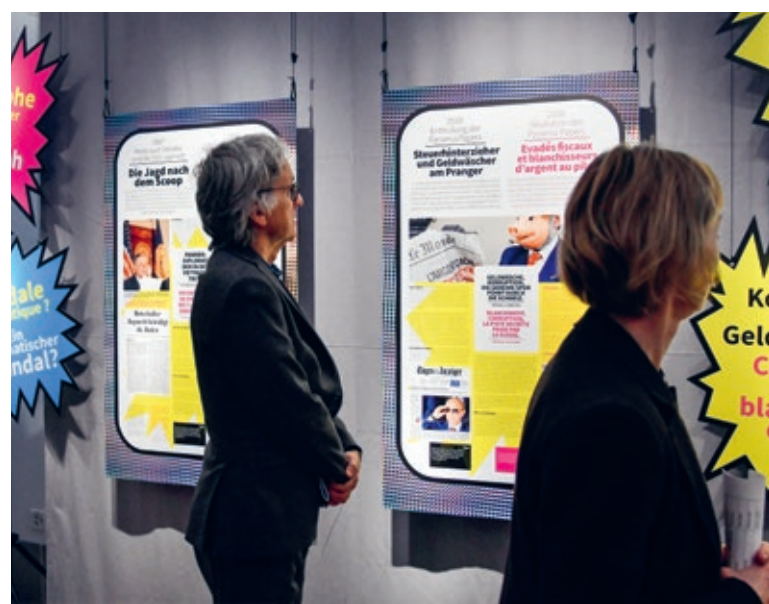
↑ Die Holocaust-Debatte im Fall Jagmetti und die Enthüllung der Panama Papers sind zwei von vielen Medienereignissen, die an der Ausstellung thematisiert werden.

Doch wieso sind diese St.Galler Ereignisse exemplarisch für die Mediengeschichte und die Ausstellung «Auf der Suche nach der Wahrheit – Wir und der Journalismus»? «Derzeit erleben wir die historische Veränderung im Journalismus sehr stark mit», sagte dazu Museumsdirektor Peter Fux an der Medienorientierung im März. Medienkompetenz und Quellenkritik würden immer wichtiger, um sich in der Flut aus Nachrichten zurechtzufinden. Genau dies sei das Ziel der Ausstellung: Sie soll aufzeigen, wie Medienschaffende arbeiten und die Besucherinnen und Besucher und gerade auch Jugendliche dafür sensibilisieren, wie und wo sie sich informieren und mit Informationen umgehen. Die Ausstellung funktioniert stark interaktiv. Die Besucherinnen und Besucher checken sich mittels Badge ein und schlüpfen während ihres Museumsaufenthalts in verschiedene Rollen. Im Bürger-Spiel können sie beispielsweise Fake News verbreiten und versu-