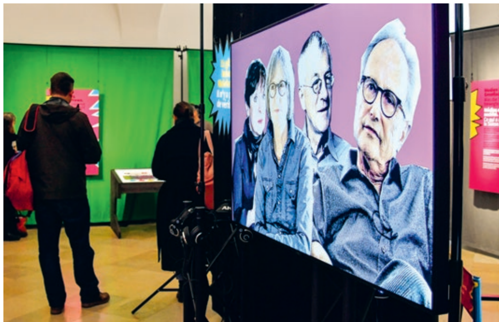
↑ Auf die Suche nach der Wahrheit begibt sich, wer die aktuelle Ausstellung im Kulturmuseum besucht. Das Ganze funktioniert interaktiv und beginnt mit einem Begrüßungsfilm.

Nach einer Stunde Rundgang durch die neue Ausstellung «Auf der Suche nach der Wahrheit – Wir und der Journalismus» im Kulturmuseum ist die «St.Galler Arena» der ideale Ruheort, um sich das Gesehene noch einmal durch den Kopf gehen zu lassen und mit Eindrücken aus St.Gallen abzuschliessen. In dunkler, ruhiger Atmosphäre laden Stühle zum Hinsetzen ein. Bei einigen handelt es sich um sogenannte Ereignisstühle. Wer sich dort niederlässt, findet seitlich befestigte Tafeln, die jeweils eines von neun St.Galler Ereignissen aufgreifen. Dazu gehören etwa die Osterkrawalle 2021 in St.Gallen. Thematisiert wird, wie Social Media und Pandemie ineinandergriffen. Ein wei-