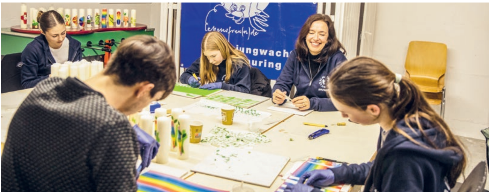
↓ Gemeinsam Osterkerzen zu machen, ist immer auch Anlass, zu lachen und sich an Erlebnisse und Ausflüge mit der Jubla zu erinnern.

Die Einnahmen aus dem Kerzenverkauf fliessen in die Jubla-Kasse und werden für Lager oder besondere Projekte gebraucht. Vor einigen Jahren stellte die Jubla St. Martin Bruggen noch bis zu 500 Osterkerzen her. «Da es aber weniger Kirchenbesucherinnen und -besucher gibt als früher, verkaufen wir auch weniger Ker-