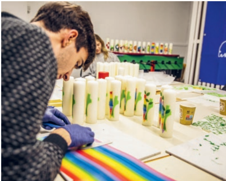
↑ Die Aufgaben sind verteilt: Während einige die Wachsformen ausschneiden, sind andere fürs Platzieren auf den Kerzen eingeteilt.