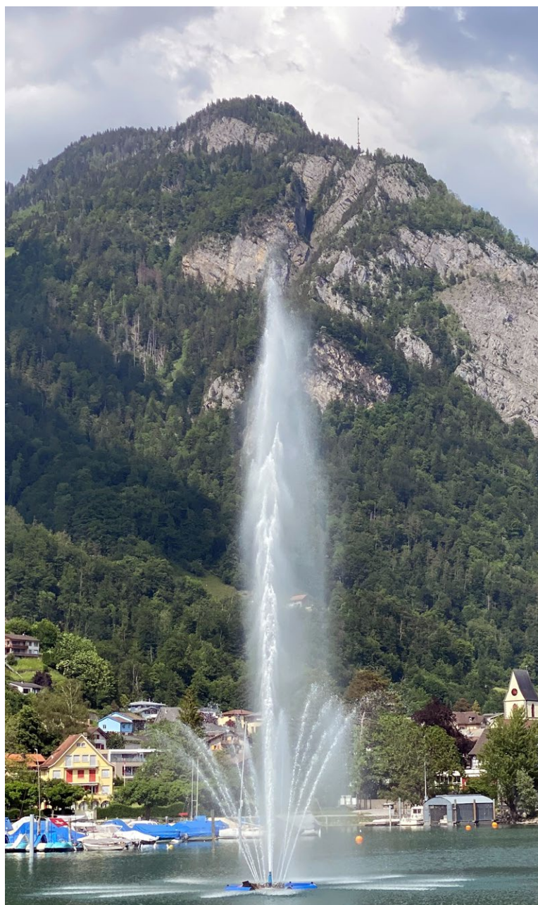
Springbrunnen in der Hafenanlage Weesen mit Blick in die Bergwelt.

Im Monat Juli ist es den meisten Schülerinnen und Schülern wie vielen in der Erwerbsarbeit gegönnt, wohlverdiente Sommerferien zu geniessen. Ferien in den Bergen, am See, am Meer oder zu Hause sind ein Segen für Körper, Geist und Seele. Im Schöpfungsbericht schaltet Gott selber einen Ruhetag ein: «Und Gott segnete den siebten Tag und heiligte ihn; denn an ihm ruhte Gott, nachdem er das ganze Werk erschaffen hatte» (Gen 2,3). Das Bedürfnis nach Ruhe und Erholung ist natürlich. Arbeitsfreie Tage verändern die Routine im Alltag. Jesus lädt ein zu ruhen. «Kommt alle zu mir, die ihr euch abmüht und Lasten trägt. Ich werde euch Ruhe verschaffen» (Mt 11,28).