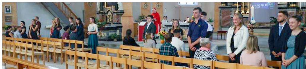
Firmung, 17. September